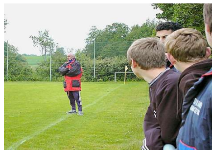
A-Junioren- Trainer Hamburger beobachtet kritisch das Endspiel.