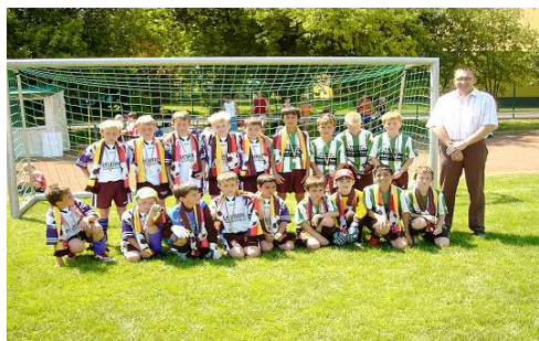
1 u. 2. Sieger F-Jgd. VB Mittelhessen Cup