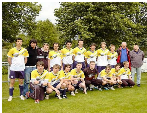
A-Junioren Vizekreismeister 2005/06