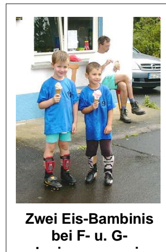
Zwei Eis-Bambinis bei F- u. G-