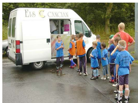
Anstehen zum Eisempfang