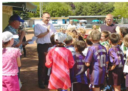
Siegerehrung beim VoBa Mittelhessen Cup.